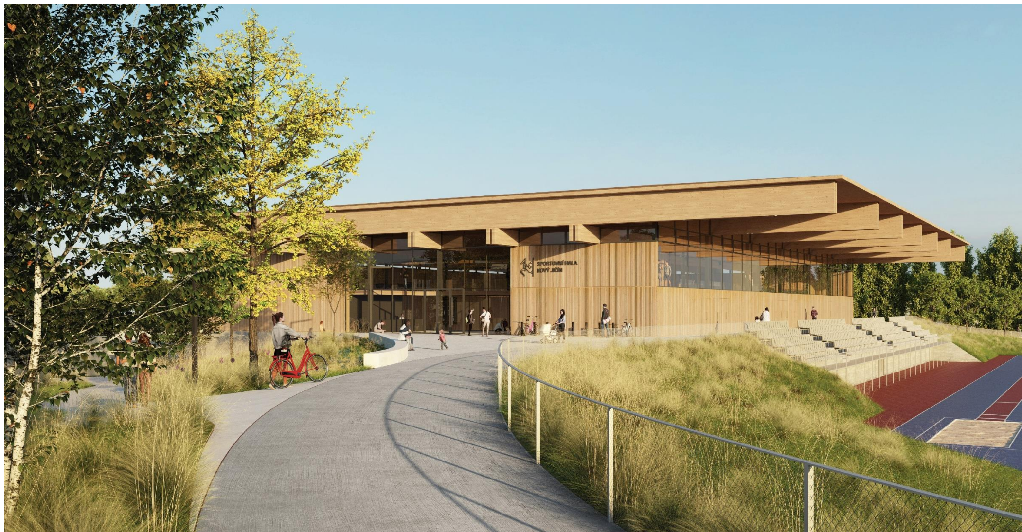
víceúčelová sportovní hala – vizualizace vítězného návrhu z architektonické soutěže