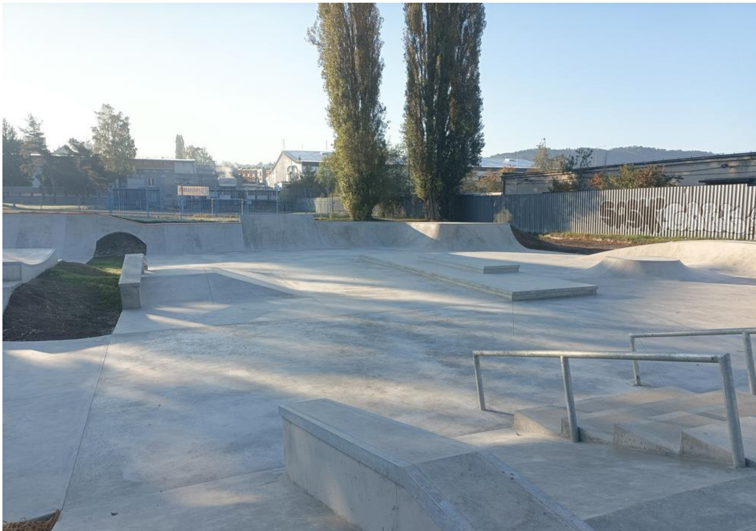
Skatepark a bikepark – realizace 2023