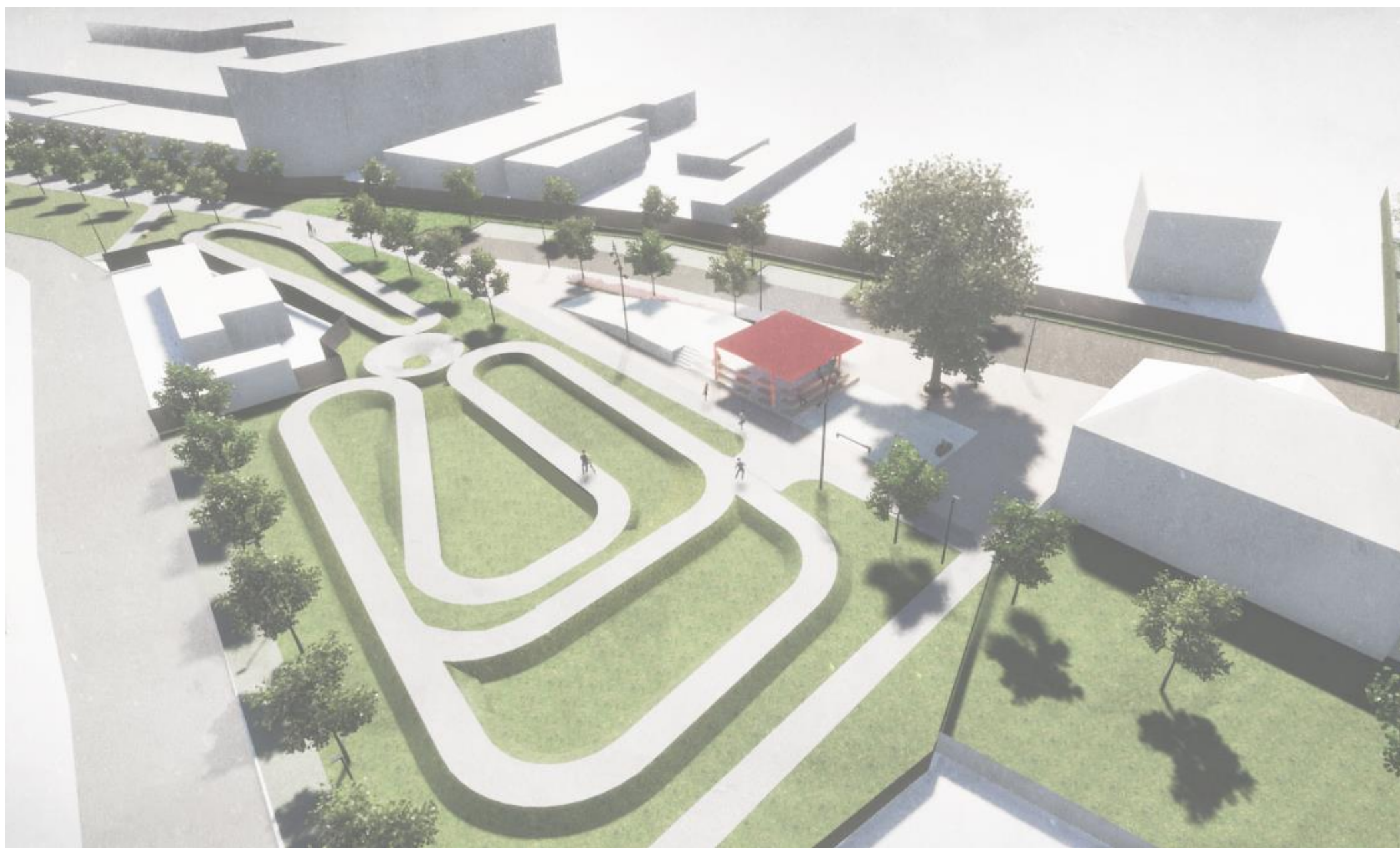
pumptrack – vizualizace ze studie