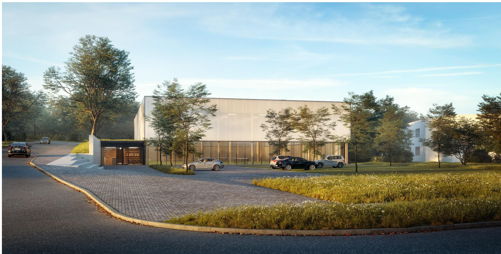
tenisová hala – vizualizace ze studie 2023